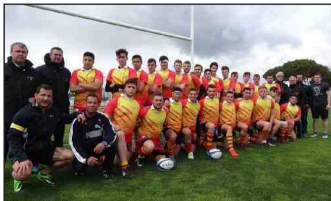
Le groupe et l'encadrement M18 du comité Pays Catalan.

Décidément, l'édition 2016-2017 est une grande et belle saison pour les différentes sélections « jeunes » du Pays Catalans. Sans préjuger du sort réservé à ces compétitions dont l'avenir dépend de la nouvelle politique sportive fédérale, le Comité du Pays Catalan les aura incontestablement marquées de son empreinte.